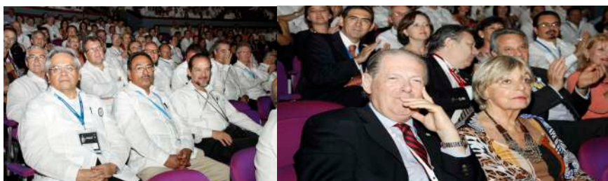
Urólogos en el acto inaugural del Congreso de la confederación Americana de Urología, en Cartagena de Indias, Colombia., 2012