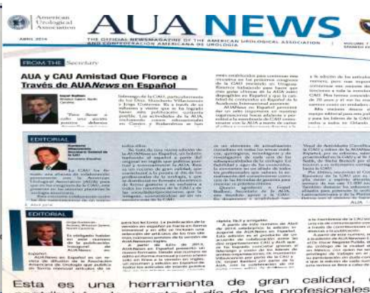
Memorándum de entendimiento entre la AUA y la CAU – AUA News en Español