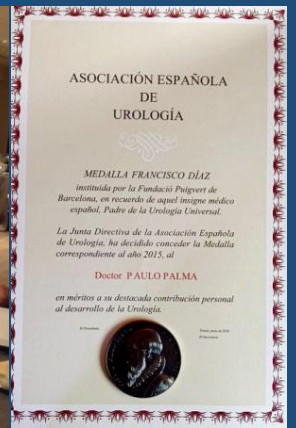
Medalla Francisco Díaz