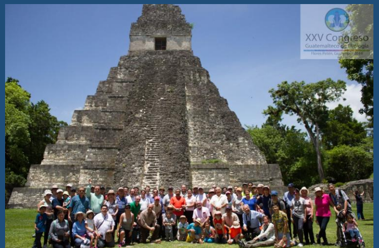
Foto panorámica de los participantes del congreso