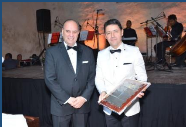
Reconocimiento a la SCU