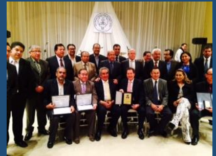
Directiva SBU y homenajeados