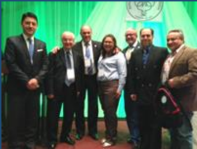
Profesores invitados y directivos SBU