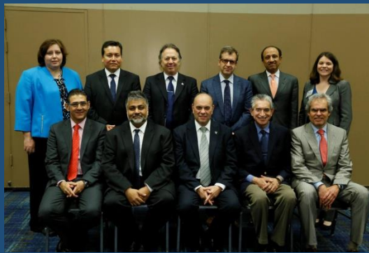
Juntas Directivas AUA - CAU