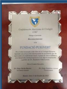
Reconocimiento a la Fundació Puigvert

Felicitemos a la Fundació Puigvert por el nivel alcanzado, que lo coloca como uno de los mejores servicios de urología de Europa. La CAU entrego reconocimiento institucional.