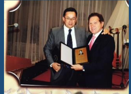
Premio Humberto Villavicencio