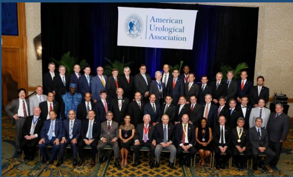
Presidentes AUA y Sociedades Urológicas Internacionales

Como ha sido durante años los congresos de la AUA han tenido un gran poder de convocatoria en la urología mundial y en la latinoamericana en especial, en New Orleans se presentaron los temas más importantes y controversiales de la urología moderna, con plenarias, cursos instruccionales, módulos de hands on training, cirugías en vivo, conferencias magistrales con los maestros más destacados de la urología actual. La sesión conjunta AUA-CAU fue extraordinaria con más de 2000 urólogos, un panel de primer orden y un temario que constituye el estado del arte del conocimiento urológico. La coordinación del Dr. Shlomo Raz, creador del programa conjunto, recibió como siempre las más calurosas felicitaciones