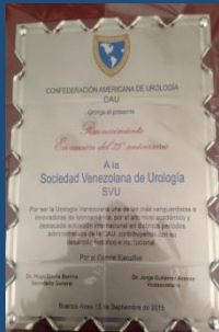
Reconocimiento a la SVU