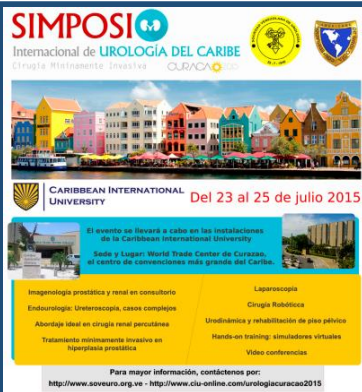
Afiche y Programa