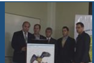
Caribbean International University