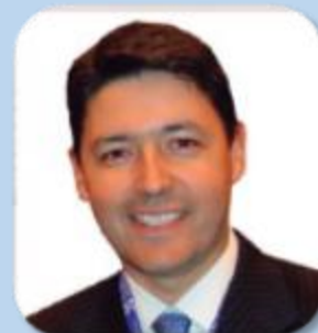
Mauricio Plata (Colombia)