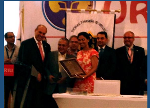
Acto de reconocimiento recibe la Dra. Celeste Alston, Presidenta de la SPU