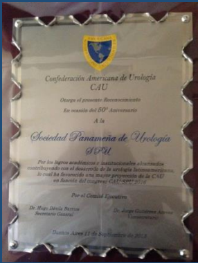
Reconocimiento a la SPU