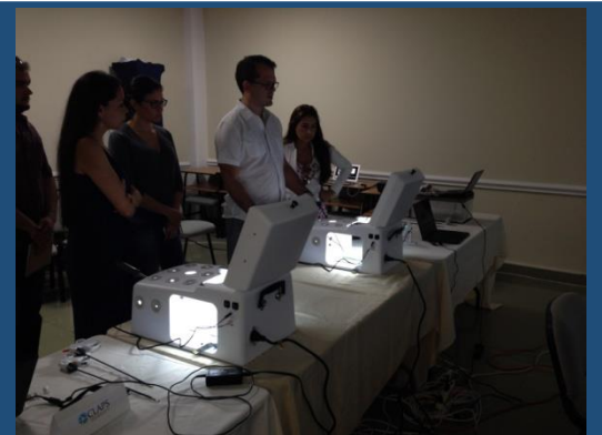
Estación de trabajo con simuladores