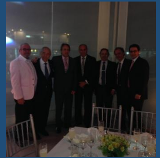
Ex presidentes CAU