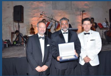
Reconocimiento a la AUA