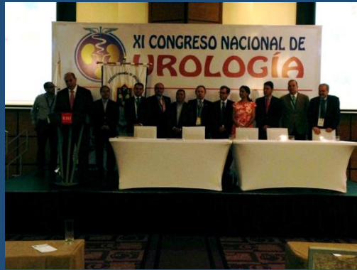
Directivos CAU -SPU con Presidentes Centroamericanos del Caribe y Brasil