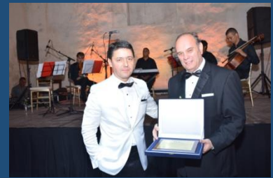
Reconocimiento a la CAU