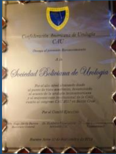
Reconocimiento a la SBU