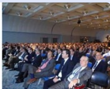
Curso CAU/AUA. 1.800 asistentes.