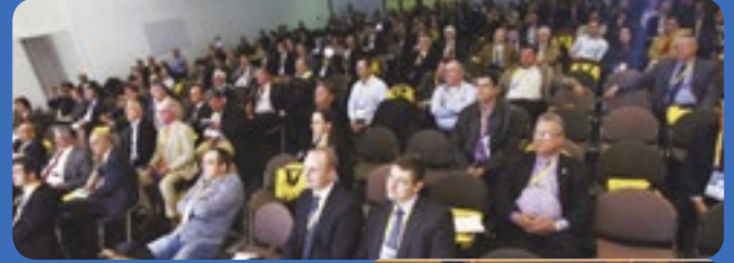
Curso CAU/EAU. 800 asistentes.